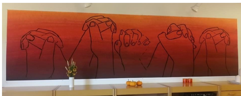
Den færdige skitse 90cm*3,20 m